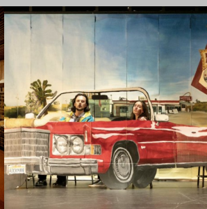
PEINTURE ET DESSIN